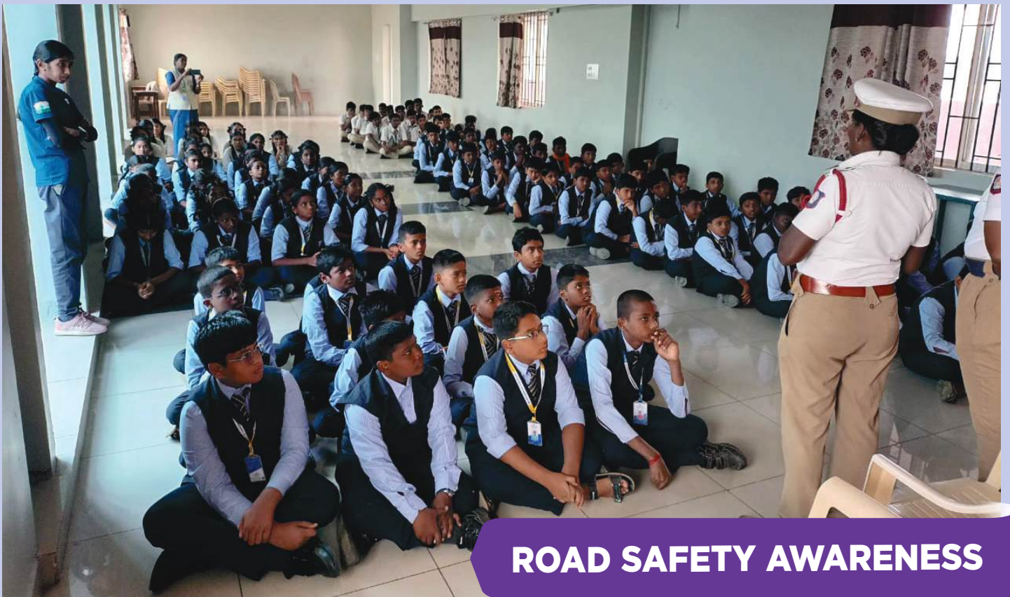
ROAD SAFETY AWARENESS