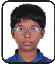
KAVIKO S GRADE-VI