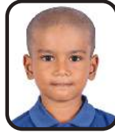
NOVA INIYANG G GRADE-II