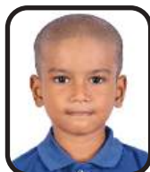
NOVA INIYANG G GRADE-II