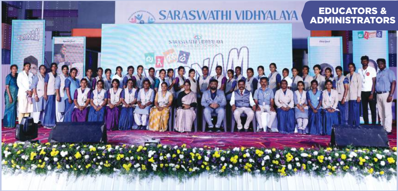
EDUCATORS & ADMINISTRATORS